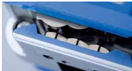
Der patentierte Verschlussmechanismus des HKE

Technisch ausgereift und fortschrittlich konzipiert sind TITAN Hülsenlos-Geräte der Begriff für rationelles und sicheres Umreifen. Der TITAN Hülsenlos-Verschluss hat sich weltweit millionenfach bewährt.