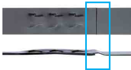
Verhindert Verletzungen: Das speziell geformte Bandende am Titan Hülsenlos-Verschluss.

Die hohe Anzahl von über 80 % an Norm- und DIN-Teilen ist der Garant für die hohe Servicefreundlichkeit dieses Gerätes.